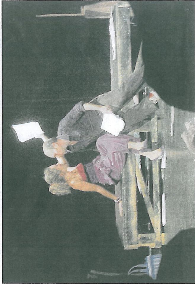
La scène de la déclaration amoureuse.