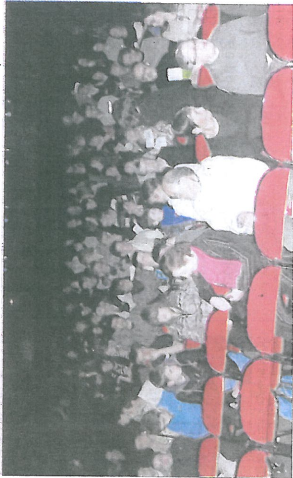
Un public nombreux pour une comédie très appréciée.